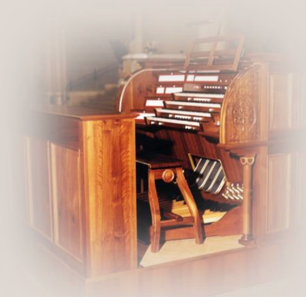
Organo Ruffatti 1965 rinnovato da Michelotto nel 2002